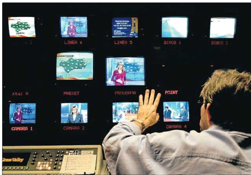
Estudio de Canal Sur, una de las cadenas que ha sufrido un mayor descenso de audiencias y publicidad

Todo ello, en medio de una caída paulatina de la cuota de pantalla (vinculada en parte a la fragmentación progresiva de la audiencia) y un fuerte descenso de